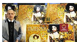
Conchita Wurst ziert Life-Ball-Plakat (Wirtschaftsblatt)