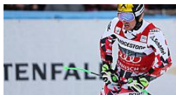
Setzt Marcel Hirscher eine Saison aus?