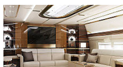
Luxus in 10.000 Metern Höhe: Mehr Penthouse als Flugzeug + Video (Wirtschaftsblatt)