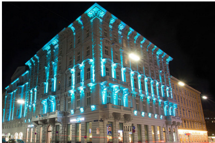
Allein 400 Zimmer umfasst das im Dezember 2014 eröffnete Motel One bei der Wiener Staatsoper. Ein weiteres Haus folgt beim Hauptbahnhof.