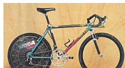
Mountainbike Megafails: Die 10 schlechtesten Erfindungen (Dirt Magazine DE - Sponsored)