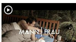
Folge 9 – One Night Stand (MANN/FRAU - BR-Blog - Sponsored)